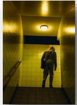
Livre aux éditions Filigranes